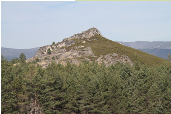
Cume da Urdiñeira (1.146 m)