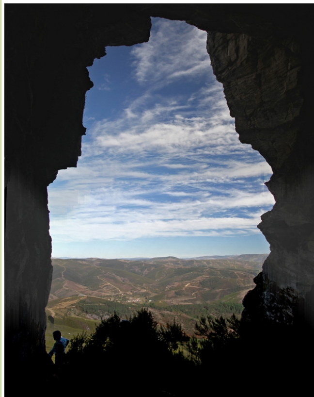
Cova das Choias ou Casa das Grallas

Nos cumes da serra da Urdiñeira, a cabalo da raia que delimita os concellos de A Gudiña e Riós, atópase unha paisaxe singular, unha parede vertical de cuarcitas e xistos, materiais de dureza e consistencia diferente, nos que os séculos de erosión, deron lugar a curiosas formas e algúns agochos entre os que destaca pola súa estrutura e situación a coñecida como Covas das Choias ou Casa das Grallas, unha cavidade que se abre en varios arcos cara ao leste e desde a que podemos gozar de fermosas panorámicas.