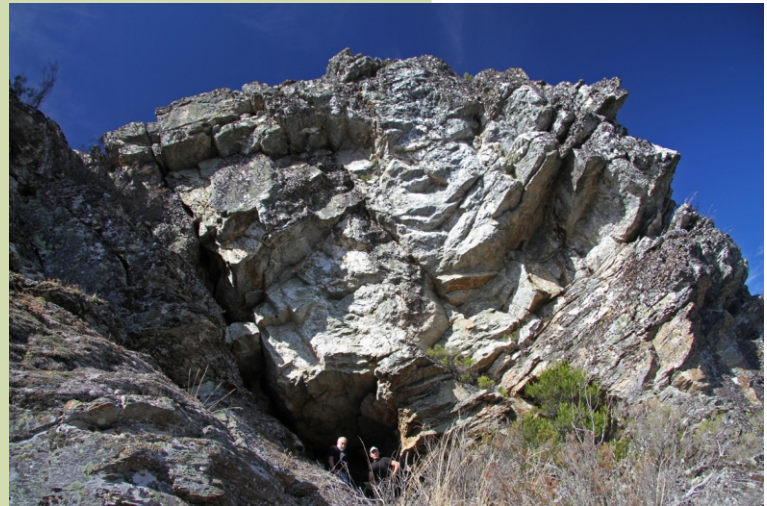
Outra buraca na Urdiñeira

Nesta serra atopáronse restos arqueolóxicos de grande interese entre os que destaca o coñecido como Tesouro da Urdiñeira, descuberto en 1926, formado por dous brazaletes de ouro e un disco de bronce que se conservan nos museos de Lugo e Ourense. Contan na zona que nas covas viviron os mouros que hai un tesouro na Fraga, un camiño soterrado ate o castro da Pedrosa e varios encantos (unha Moura que se peitea, un grandísimo culebrón...). Tamén din que se atopou un coitelo de ouro.