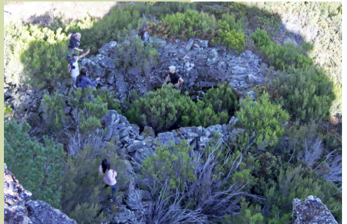
"Lobeira", foxo dunha trampa para cazar lobos.