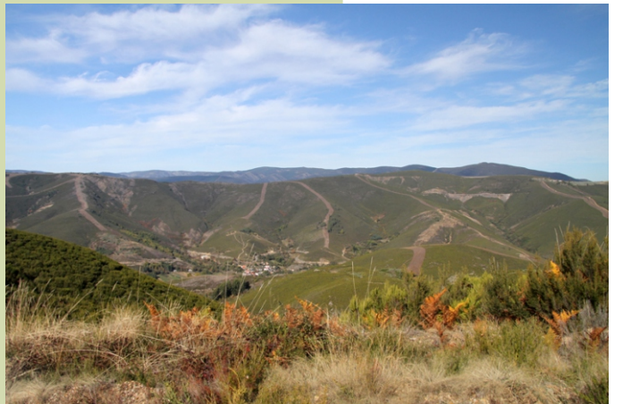
Veiga de Nostre desde A Urdiñeira